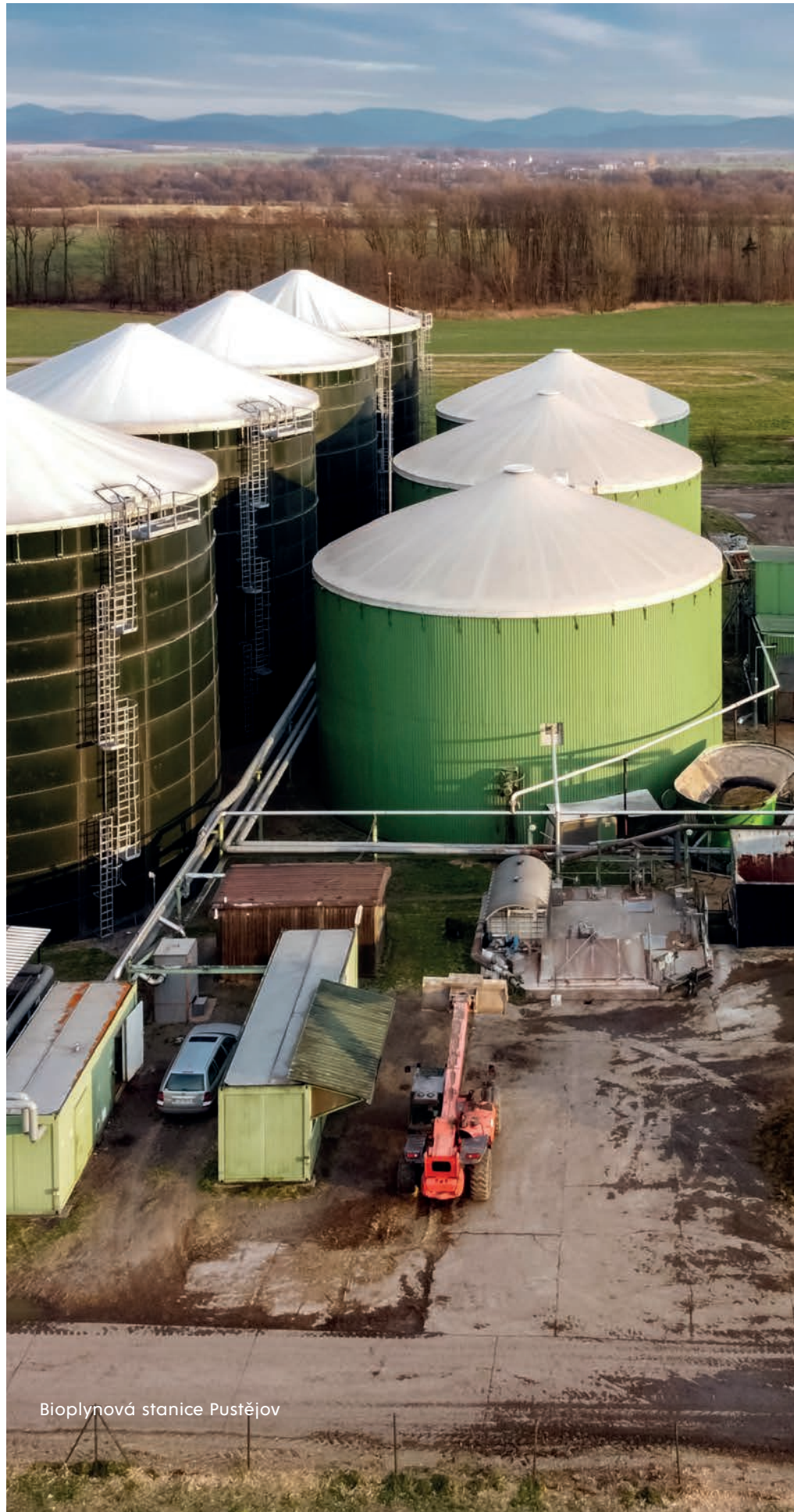
Bioplynová stanice Pustějov