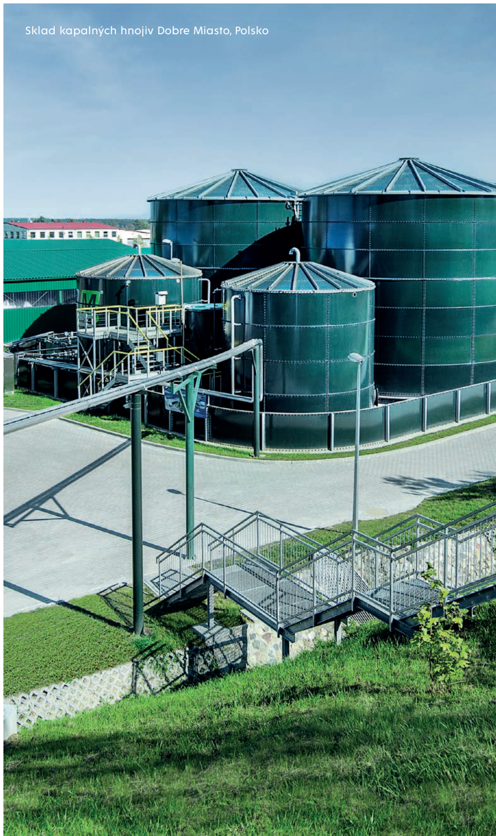
Sklad kapalných hnojiv Dobře Miasto, Polsko

Plášť nádrže je sestaven z plechů spojených šroubovými spoji a utěsněných trvale pružným tmelem. Je vyztužen úhelníky. Dno tvoří nejčastěji železobetonová deska, případně je dno ocelové svařované. Příslušenstvím nádrže, které je určeno účelem použití nádrže, jsou revizní vstupy, žebříky, plošiny, schody, pomocné a technologické konstrukce, potrubí, míchadla, čerpadla, tepelná izolace, uzemnění apod. Nádrž může být zakryta střechou. Nádrže jsou dimenzovány v souladu s normami ISO 28765, EN 1990, 1991 a AWWA D103.